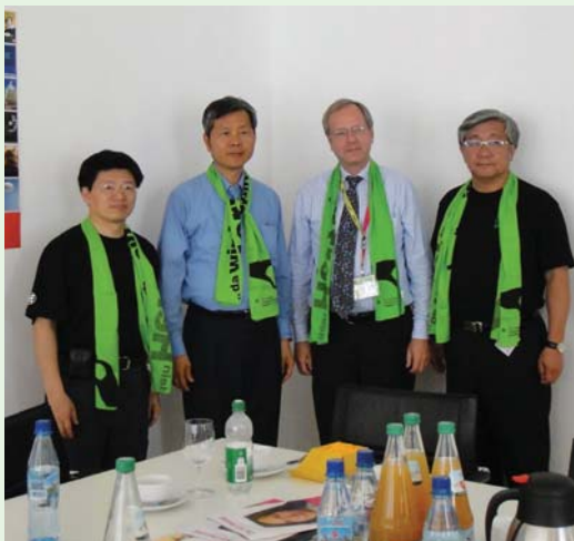
拜會教會日主辦單位後合影。(100.6.4)

由於PCT一向積極參與普世教會活動，關懷全球，走向全球，於是信如建議總會規劃活動來參與德國教會日，並以「心靈關懷與社會責任」為主題，策