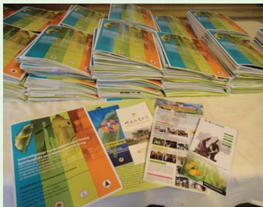
從台灣事先印製、空運到德國的程序單及介紹各單位的文宣品。（100.6.2）

而與PCT共同主持宗教對話禮拜的尼可拉教會富勒牧師，更一再強調：「從和平禱告會促成的蠟燭革命經驗中，我確信，我們的普世宣教應該勇敢