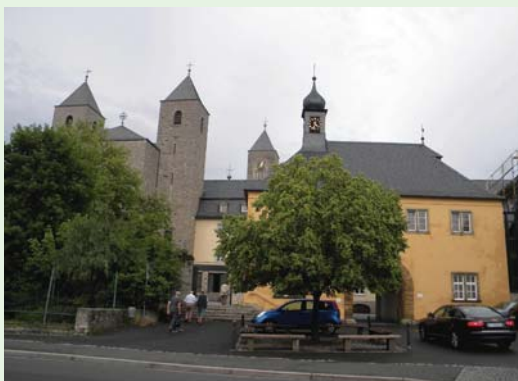
明斯特史瓦札赫修道院，教會聖堂屋頂有四個尖塔，因此所屬出版社命名為「四塔出版社」。(100.6.6)

的台灣經驗之外，另一個重要目標，則是在巴伐利亞邦烏滋堡的明斯特史瓦札赫修道院，策劃一場東、西方宗教——古倫神父與我——的心靈對話，並由修院所屬四塔出版社（Vier Türme-Verlag），出版這部對話錄。