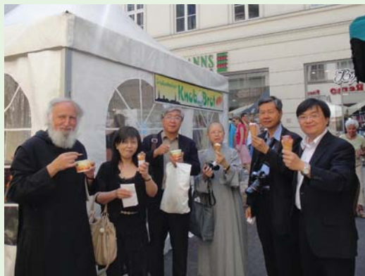
前往萊比錫參觀，神父、牧師與法師一行人在街上輕鬆享用冰淇淋。(100.6.5)

樣站在街頭的攤販區，吃起了冰淇淋與速食餐，這樣的奇景，當然不免被「拍照存證」了下來。