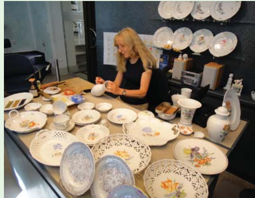
參觀以瓷器聞名的邁森古城。(100.6.3)