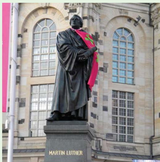
德勒斯登老城廣場的新教教堂前，矗立著宗教改革領袖馬丁路德銅像。(100.6.2)

6月2日傍晚走向城中心廣場時，看到前方一座非常宏偉的教堂，我詢問陳啓應牧師，是否分辨得出這到底是天主