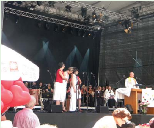
數百位信眾在尼古拉教堂外的戶外廣場，頂著太陽舉行大場的禮拜活動。(100.6.5)

雖然鎮日奔勞而疲憊不堪，牧師們逛起量販店，還是顯得十分悠哉！有的趁便買些回國送人的「等路」，有的為家屬購置衣物，有的巡行端詳購物架上的貨品，評比德國與台灣的物價。總