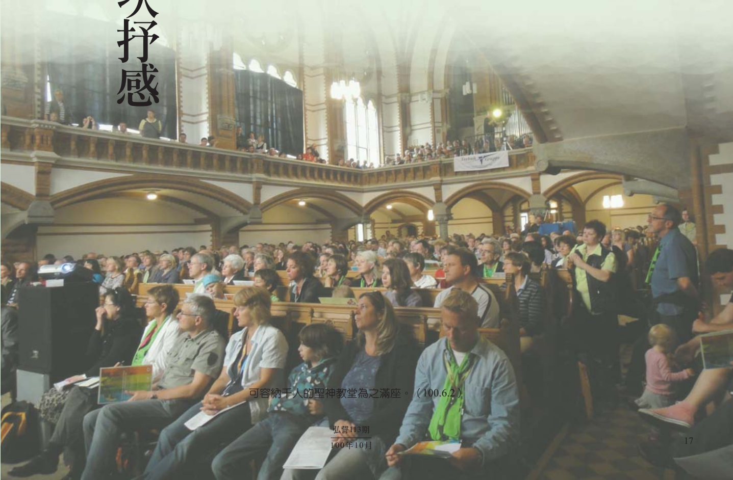
可容納千人的聖神教堂為之滿座。(100.6.2)

終於在當地時間6月1日清晨，平安抵達法蘭克福機場——歐洲最繁忙的航運樞紐。在這座機場稍事停留之後，隨即轉機前往德勒斯登。抵達德勒斯登機場時，Ausspan旅館主人——敘利