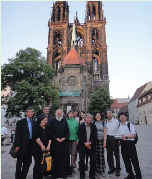
於邁森拜訪柏林差會途中，合影於教堂前。(100.6.3)