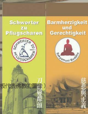
台灣基督長老教會預先已作好會場佈置的規畫（右邊看板代表佛教的圖像）。