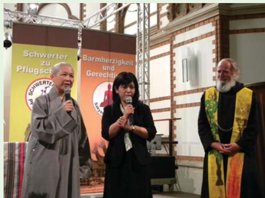
回答現場觀眾的提問。（100.6.2）

生平第一次與一群基督教會領袖、牧師與平信徒，近距離相處了那麼多天，真是很新鮮的經驗，除了受到他們悉心的照顧外，我也看到PCT會友們強烈的本土意識與國家認同，以及爲了讓