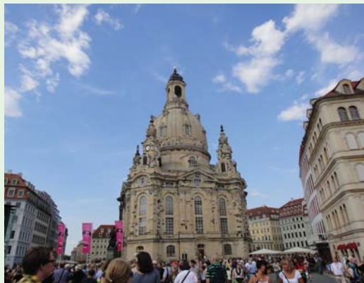
教會日期間德勒斯登天主教堂前的廣場，湧入大量的信徒與遊客。（100.6.2）

果然不負眾望，禮拜當天，到來了一千兩百多位聽眾，讓聖堂座無虛席，甚至連走道都擠滿了人，是一場非常成