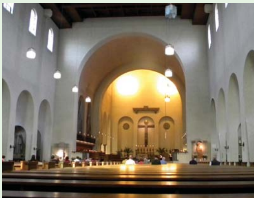
瑪莉亞教堂內修士們的晚禱氣氛莊嚴。(100.6.8)