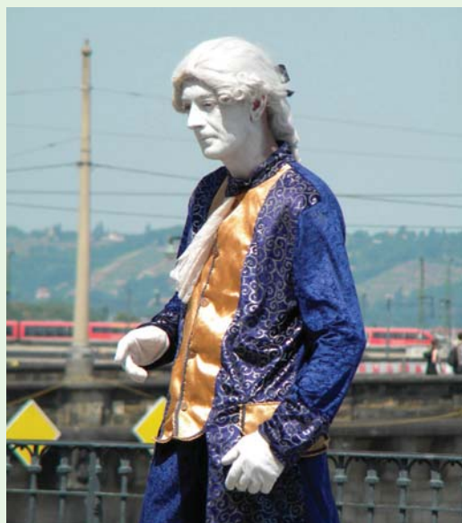
扮成雕像的街頭藝人，良久維持固定姿勢。(100.6.4)

由於我身邊沒帶零錢，有的只是助理於我出遠門前，幫我兌換的100歐元紙鈔，因此雖然站在一旁觀賞了「它」半晌，卻是一毛也沒丟進鐵碗裡。想向牧師們借點零錢，又遲疑而作罷。吃完冰淇淋上路時，不禁有點「平白消費」