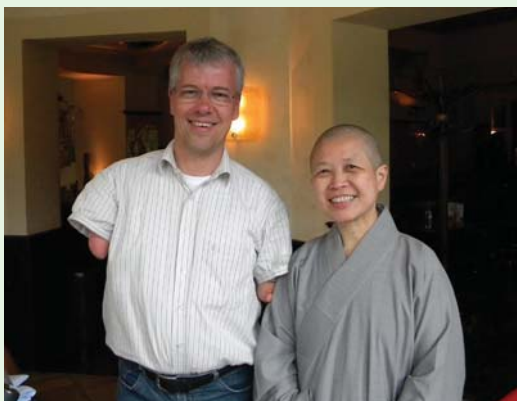
德國肢障奇人施密特牧師與昭慧法師合影。(100.6.2)

餐廳位於易北河畔的鐵橋下方，可以眺望易北河及對岸美景。當日陽光普照，餐廳外有好多人在露天用餐，當我舉起相機向他們拍照時，他們不但不以為意，還很大方地紛紛舉手招呼入鏡。讓我在一本正經的德國人身上，感受到日耳曼式的友善與幽默！