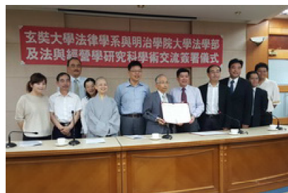
105.5.5 法律系和日本明治學院大學舉行「學術交流簽約儀式」。