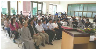
105.5.18 玄奘大學舉行第三屆「穿越時空感恩月」浴佛大典，圖資大樓一樓大廳現場，學校教職員工踴躍參加。