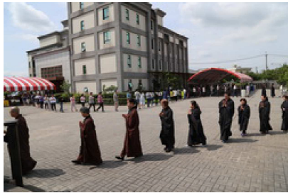
105.5.14 本院舉行浴佛法會，大眾念佛、繞佛巡行鹿野苑。