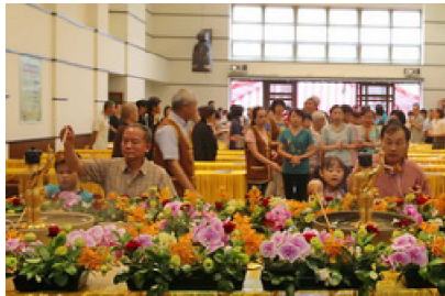
105.5.14 共約三百五十人參加，信眾扶老攜幼虔誠浴佛。