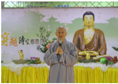
105.5.18 法源講寺住持真理法師致詞。