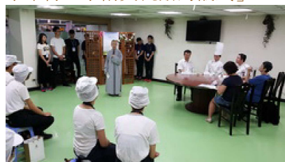
105.5.5 中午，昭慧法師為蔬食烹飪比賽開場致詞。