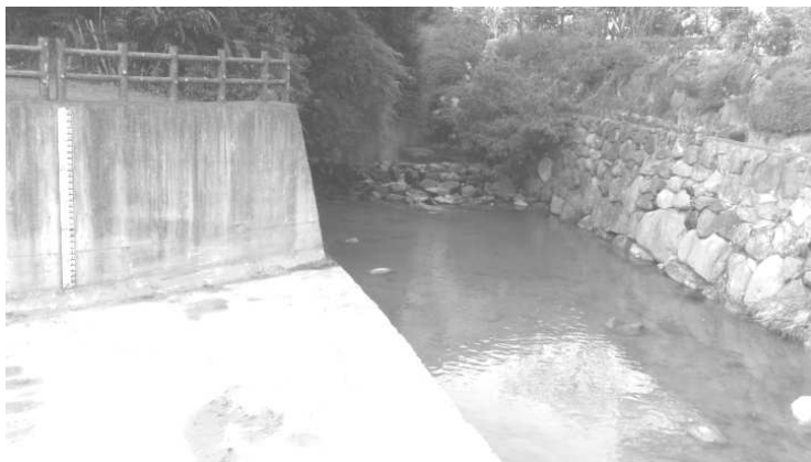
圖八、大溝溪分洪道起點