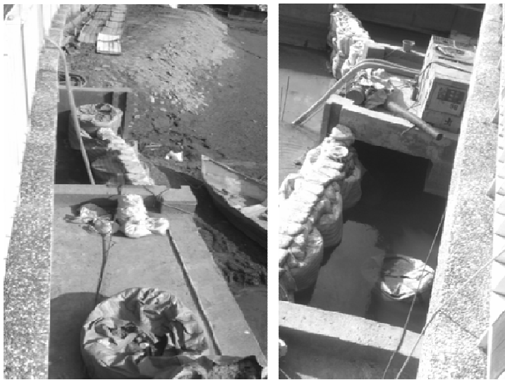
圖九、左為牛稠溪出水口,右為大溝溪出水口,兩個出水口位置相近。

另引用水利處說明:「北基地周邊住戶淹水主因係目前僅靠原有明溝排水,若未來慈濟開發後改配置 2 x 1.8 公尺箱涵,且增設排洪設施後,情況應會獲致改善。」 38 故由此得知,慈濟若能盡速完成變更,反而有利於北基地周邊排水,遠離原本淹水之患。