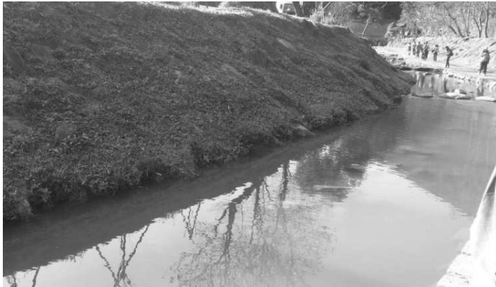
圖六、大溝溪的溪水平日亦較為混濁，乃含砂量較高之因素。

大湖山莊街之淹水問題，主要仍在大溝溪上游。大溝溪溪水含沙量多，水質較為混濁（圖六），可見上游部分的土質鬆軟、易沖刷而下，所以上游是否因地質問題或水土保持是否恰當是為疑點，需做進一步的探討；溫妮颱風造成的災情，除原本上游違建，尚有下游箱涵遭泥沙與垃圾堵滯，可見上游的水土保持應再作加強外，同時也必須定期疏通下游之明溝與箱涵。