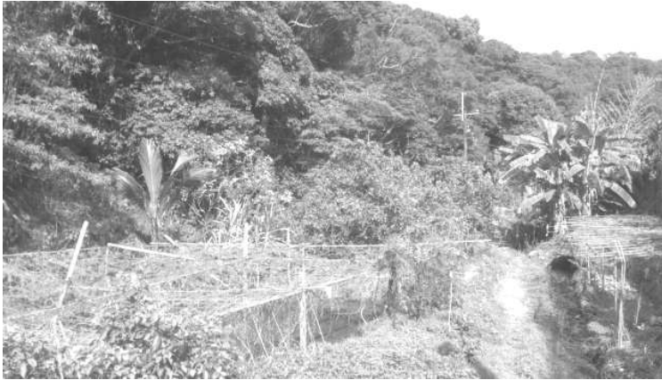
圖二、北基地東北側靠順向坡之私人農地，右方之溪溝即為牛稠溪。

於北基地東北側（圖二）與南基地北側（圖三），山坡地皆屬順向坡，而在目前《主計畫書》中提到為聯絡南北基地兩側，須建造一條聯絡道路，並採取高架道路， 7 然而此舉勢必動到順向坡與坡腳，因此對於地層滑動的問題將有極大之疑慮存在。