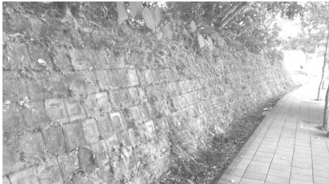
圖四、成功路五段旁之擋土牆，此處為順向坡。