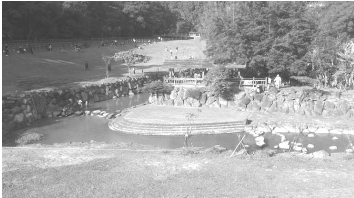
圖七、大溝溪親水公園其生態滯洪湖一隅

北基地北側農地地勢較低，若遇強降雨，低窪地區的確可能淹水。然而這項問題勢必要等慈濟將基地柏油路面刨除，並降低基地高度或低窪地區填土墊高，方可解決。