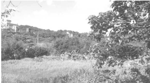
圖一、北基地後方較低窪之農地。

北基地後方尚有一塊地勢較低窪之農地（圖一），若牛稠溪因水量過大不及排出時，確有可能反淹低窪地區。而居民質疑北基地土地被填高 5-8 米，造成基地高於田地 2 米以上，導致淹水。