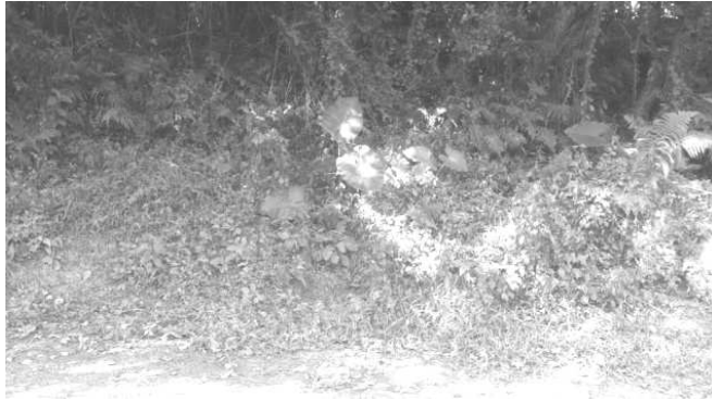
圖三、南基地北側，緊鄰坡地之國有道路，坡腳已有些許破壞之情形。