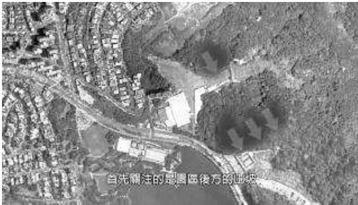
圖十、箭頭所在範圍即為順向坡之範圍

就基地範圍內之坡腳部分做檢視，事實上在慈濟購地之前，早已受不同程度之破壞。且計畫 8 米道路由地圖來看亦無動到順向坡。而且南北基地高架聯絡道路，係屬都市計畫委員會所提議，況且慈濟已有回應因康湖路已通，應無必要再建置聯絡道路，故若慈濟能避免此高架道路之設立，則完全沒有順向坡與坡腳之問題存在。（圖十） 39 故依照建設範圍來看，主建物並非位於山坡地之上，在建設之上，此點並無太大問題。