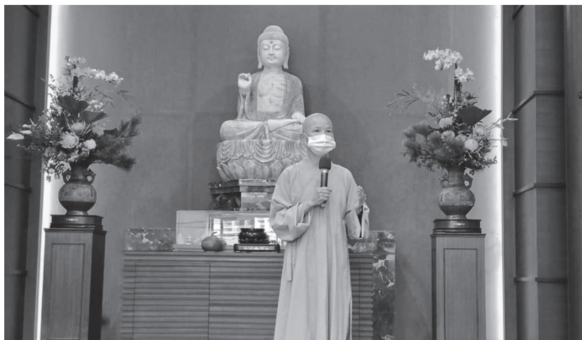
◀ 院長圓貌法師致詞，期勉與鼓勵學員。(110.9.12)