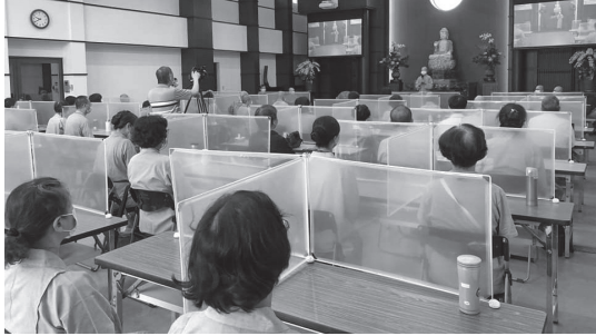
▲ 因防疫期間室內空間人數規定，師生分別安坐於無諍講堂與齋堂兩處，每張桌前皆有隔板。（110.9.12）

眼淚，他問我為什麼？我說：那應該是你宿世以來跟佛教有很深的緣分，再透過一些音聲的敲擊，讓你善根發現。