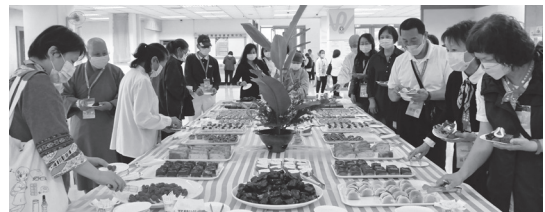
▲ 中場茶點交誼時間，大會備辦豐美的茶點招待來賓。（110.11.6）