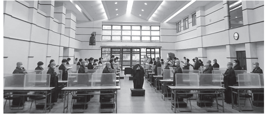
▲ 下午四時，大眾於隔板座前戴著口罩課誦。課誦時莊嚴梵唱的和諧共鳴，穿越隔板與口罩，向三寶讚頌，為眾生祈福。（110.9.12）

佛陀在《阿含經》提到，因為依止善知識，才能夠證得無上正等菩提。所以在整個修學佛法的次第裡面，最難的是親近善知識。在佛教弘誓學院，我們很慶幸，所依止的指導法師昭慧法師，是一位勇猛的菩薩行者；學院裡的教師群，也都學有專精且富有教學的熱忱。所以大家進入佛學院，要抱著質直的心，親近善知識來修學，安住在戒定慧三增上學的修習。如果能夠做到這些，就算是遇到生活的挑戰、學習的困難，都能在接受與超越這些挑戰的過程裡，藉由菩薩行漸漸的增上，成為我們修學佛法的資糧。在佛教弘誓學院的修學，不是只有法義的深入，也是學佛心性