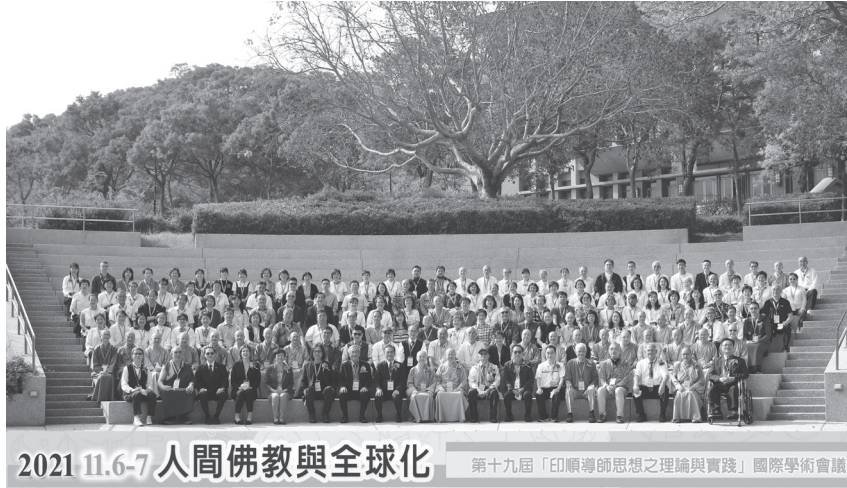
◀ 開幕典禮後，眾人於戶外階梯廣場合影留念。 (110.11.6)

印順導師是一代佛學巨擘，同時也是證嚴上人的師父，他給上人六個字：「為佛教為眾生」，印順導師完備了「人間佛教」的思想，上人則是信受奉行一輩子，就是為了能夠實踐這六個字——把佛教生活化、菩薩人間化，開闢四大志業——慈善、醫療、教育、人文，再加上國際賑災、社區志工、骨髓移植、推動環保，為八大腳印。