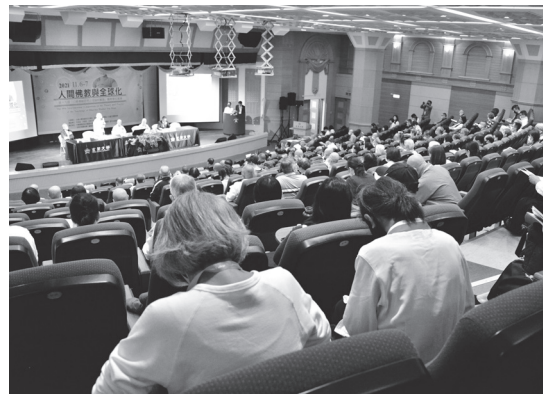
▲ 由玄奘大學宗教與文化學系、慈濟基金會與弘誓文教基金會共同舉辦的「印順導師思想之理論與實踐——人間佛教與全球化」國際學術會議，11月6日上午8時30分，於玄奘大學圖資大樓慈雲廳隆重展開，會議為期二日（6、7日），共計有三場新書發表、十場論文發表，並另有「青年論壇」和「新冠疫情下的佛法省思」論壇。第一天議程共約300餘人共襄盛會。

授致詞：印順導師研討會舉辦至今已第十九屆，實屬難能可貴，自己每年參加都能學到新的研究成果，今年拜讀了昭慧法師與彼得·辛格教授的新書覺得非常受用。細思自己的與會因緣，李教