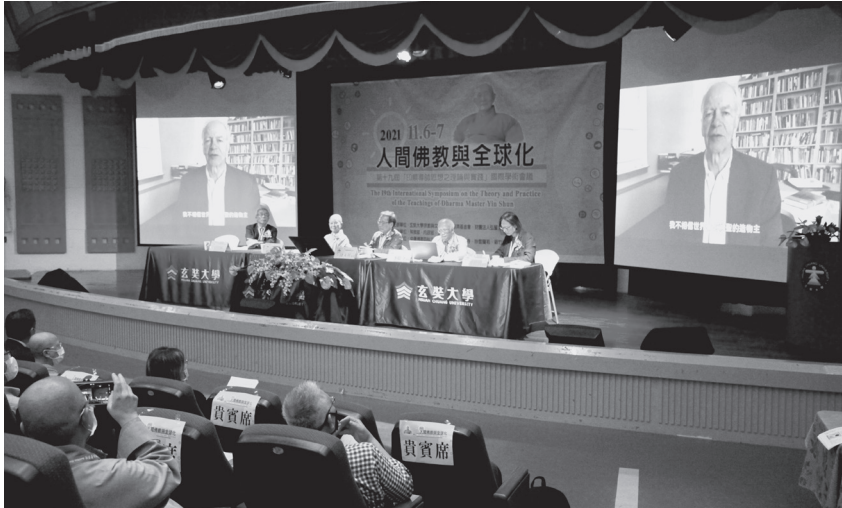
◀ Peter Singer教授因配合防疫政策而無法蒞臨大會，特別以預錄了25分鐘致詞與精采的新書發表影片呈現。（110.11.6）

歸，即理性地計算減少痛苦／增加快樂的行動後果來判定一行動是否為道德的（頁17）。但嚴格來說，佛家所重的慈悲並非天生的情感，實乃由般若智之修行而來，儒家却直接指認同情共感的不安不忍之心是生命生而有的善性，是生命的實理實事。但二家實都以修行者之自主自由決定作為行為之道德的根源所在，實無違犯「自然主義」之謬誤。反之，效益論若依穆勒（John Stuart Mill）之以人們本性就是意欲快樂，討厭痛苦，來證成極大化每個人的快樂為道德的理由，實有從實然推論應然的謬誤在內。效益主義以理性判斷行動所對之受體（即一切有情生命）是否具有感受利害的能力與實質的利害之結果為道德之