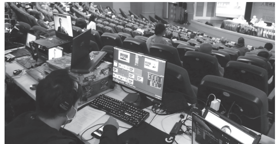
▲ 因疫情原因，本次國際學術會議部分學者透過ZOOM線上發表論文及討論。（110.11.6）