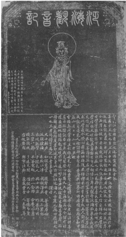
圖一 宋闕名畫（《歷代名畫觀音寶像》收錄）