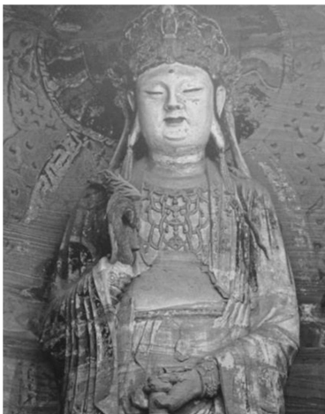
圖三 楊枝觀音（四川安岳圓覺洞北宋石雕）