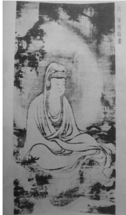
圖二 宋代白衣觀音（《歷代名畫觀音寶像》收錄）